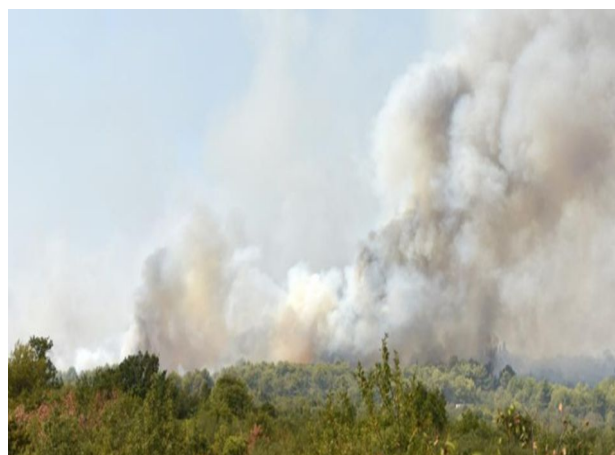
Detalji požara na području općina Žminj i Bale

Ozbiljan i profesionalan pristup svakoj dojavi i intervenciji, te kvalitetna i redovita obuka profesionalaca i dobrovoljnih vatrogasaca rezultirale su izvrsnosti na samim intervencijama i daju nam za pravo da budemo glavni nosioci sustava Civilne zaštite na našem području.